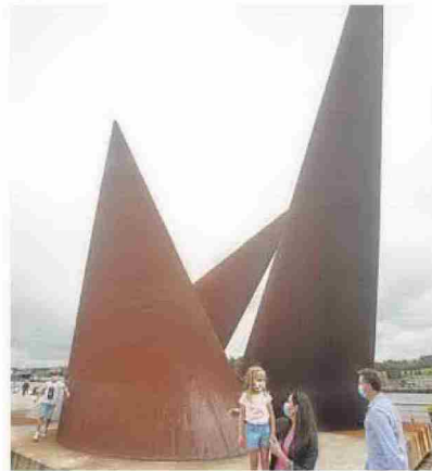
La escultura 'Avilés' de Benjamín Menéndez. MARIETA

«El discurso es siempre lo más importante en su obra, siempre en torno al patrimonio industrial», señala sobre Menéndez